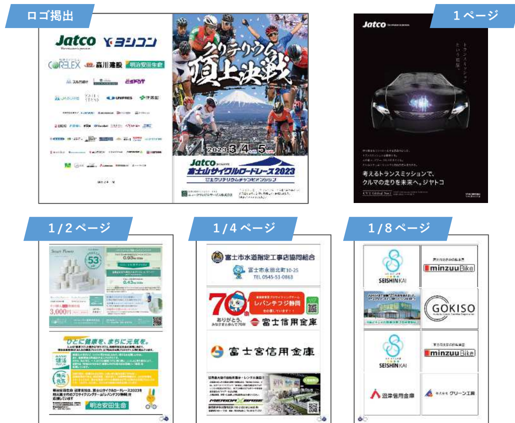
※写真は過去大会のものです