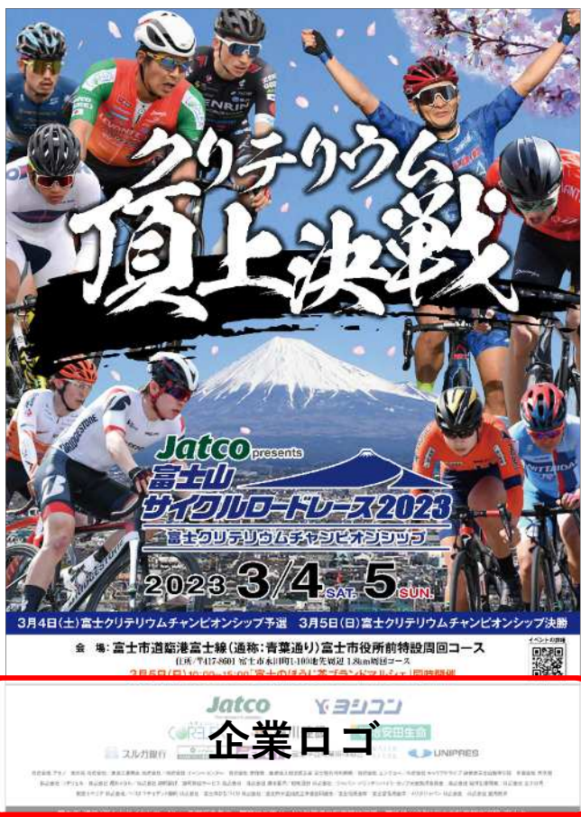
※イメージは過去大会のものです

大会ポスター及びチラシへ企業ロゴ等を掲載します。ポスターとチラシは市内各所に配架・掲示し、チラシは市内の全戸（約9万2千戸）へ配布します。